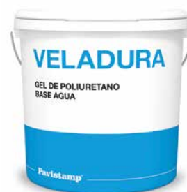
Gel de poliuretano base agua