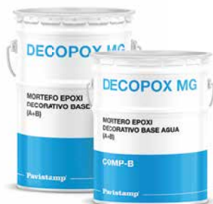
Mortero epoxi decorativo base agua (A+B)