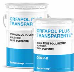
Esmalte de poliuretano alfático base solvente.