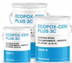
Mortero epoxi tricomponente Barrera de vapor (A+B+C)