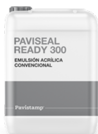
Esmalte acrílica convencional