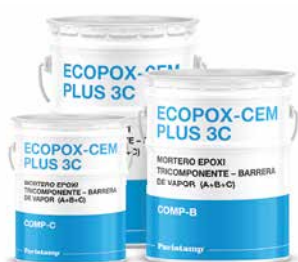
Mortero epoxi tricomponente Barrera de vapor (A+B+C)