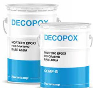
Mortero epoxi decorativo base agua