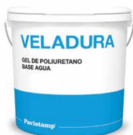
Gel de poliuretano base agua