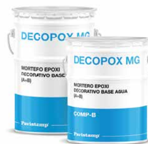
Mortero epoxi decorativo base agua (A+B)