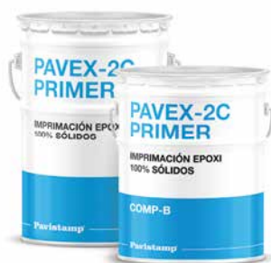
Imprimación epoxi 100% sólidos