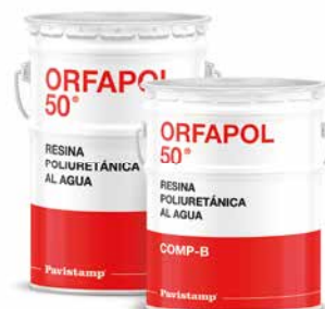
Resina poliuretánica al agua