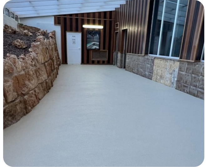
Detalle actual: Revestimientos sin igual en un lugar con detalles excepcionales.