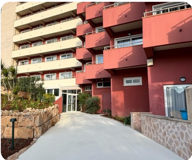
Elementos técnicos: Zonas en las que el cuidado estético y la seguridad han sido tomados en cuenta.