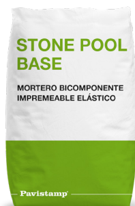
Mortero bicomponente impermeable elástico