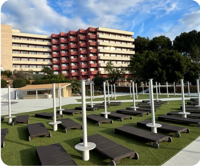
Zonas de Relax: Las vistas se complementan con un extremo gusto y practicidad.