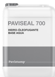
Hidro-oleofugante base agua