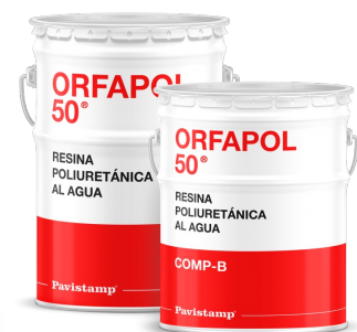
Resina poliuretánica al agua