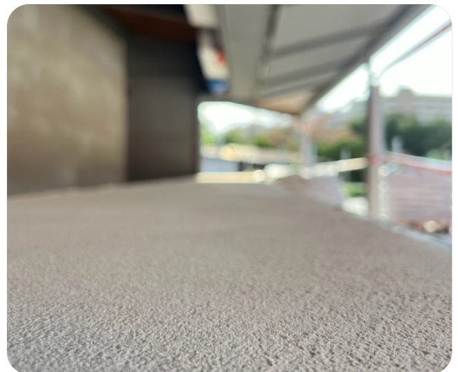
Mobiliario y diseño: Un importante factor en el diseño es la conjunción y mezcla de estilos.